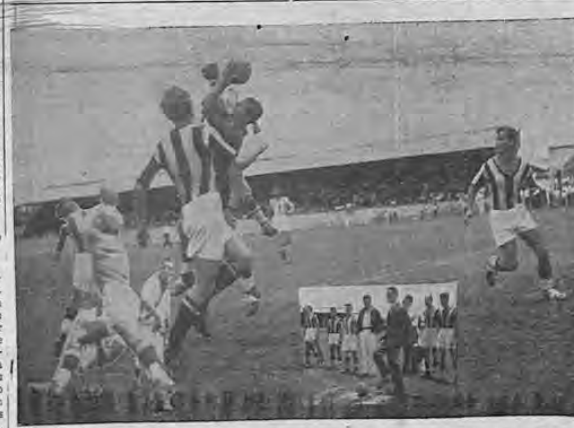
Aspecto del jurgo celebrado el domingo, por el teatro "Copa Guatemala" entre los primeros equipos de la Sociedad Gimnástica Española y el Cartaginés.