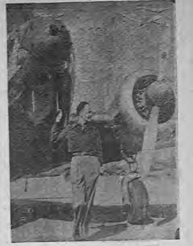
James J. Mattern, veterano y famoso aviador, frente a un aparato en California poco antes de salir en busca de los aviadores soviéticos perdidos en el Arctico.