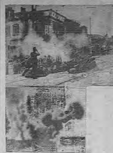
Una ofensiva tremenda se está llevando a cabo contra las posiciones chinas de Shanghai, por parte de los japoneses. En el grabado, arriba en el área de Tientsin las baterías japonesas se ven en plena acción. Abajo: En Tientsin, el edificio telefónico en llamas.