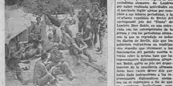
Arriba del grabado, norteamericanos descansando en La Sierra. Fuera fotografías en el frente, en una tréuga del combate. Abajo, miembros de un batallón inglés charlando.

BERLIN, 23.—El jefe de la sección extranjera del partido nazista alemán Ernst W. Böhm ha anunciado que se propone obligar a los gobiernos extranjeros a que den reconocimiento y protección a los funcionarios y grupos nazistas en sus territorios. Esta cuestión ha hecho una crisis con motivo de la expulsión por el gobierno inglés, de dos periodistas alemanes de Londres por haber realizado actividades en el territorio inglés a favor del partido nazista.