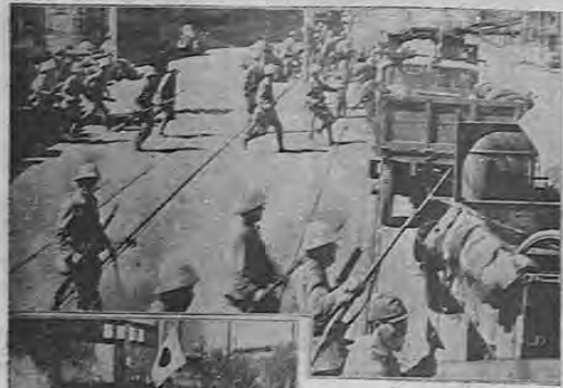
Después de la toma de Tientsin nos llegan estas telefotos por aéreo de los Estados Unidos. Arriba, fuerzas japonesas ascendiendo a grandes camiones para salir hacia las avanzadas. Abajo, otro aspecto de las recientes victorias de que hemos venido informando.